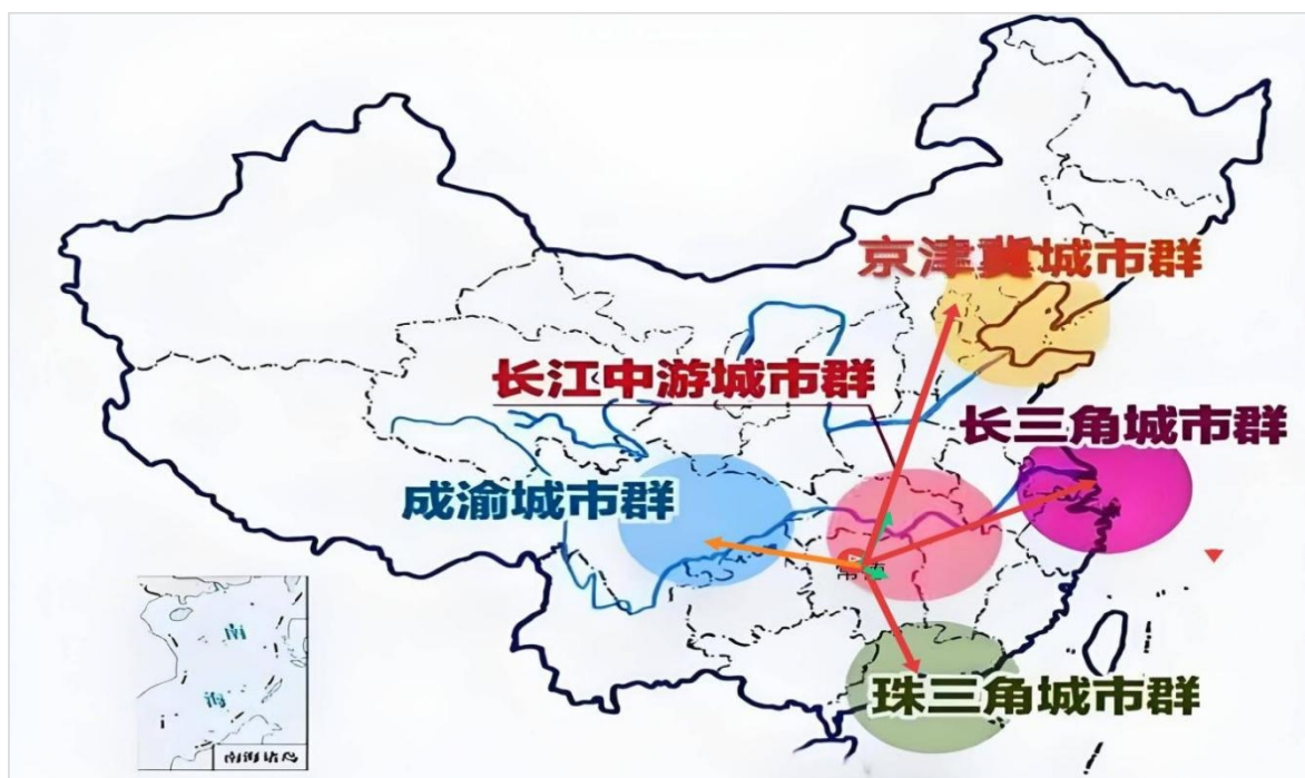
专栏：常德与重点城市群连接示意图

抢抓国家推动湘鄂渝黔革命老区振兴发展机遇，主动加强区域产业协作，积极争取国省资金支持，推动在常设立革命老区产业协作示范区，通过税收共享等方式吸引周边地市共建产业园。联合张家界、湘西、黔江等地区积极申报“湘鄂渝黔革命老区中欧班列集结中心”，打通常德产品出境通道。强化与张家界、湘西州、恩施、铜仁等地区的文旅协作，共同融入“大张家界”国际旅游品牌体系，积极争取相关县市区纳入空间布局范畴。联合策划推广“大武陵山水画廊”“红色记忆·长征足迹”等跨省精品线路。